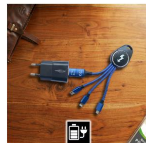
USB Ladegerät €6,00