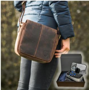
DER SOUVERÄNE 5-teiliges Set | Für Alltag & City

Link: https://www.benbag.de/#benbag-sets