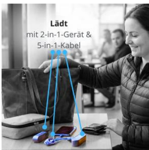
Wärmen & Laden: Handwärmer + Powerbank (zwei 2-in-1-Geräte) €35,00

Link: https://www.benbag.de/collections/benbag-zubehoer