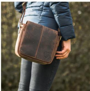
DER SOUVERÄNE Tasche pur

Link: https://www.benbag.de/#benbag-taschen