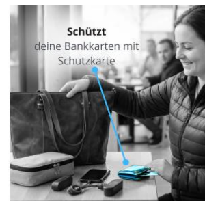
Datenschutz: 2 Schutzkarten €10,00