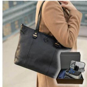
DIE EXECUTIVE 5-teiliges Set | Shopping & Office