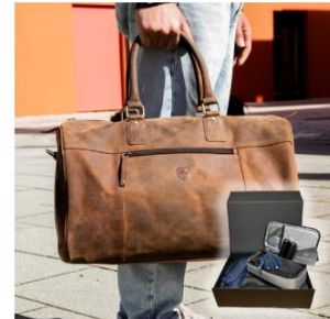
THE VOYAGER 5-teiliges Set | Für Reisen & Gym