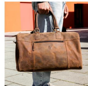
THE VOYAGER Tasche pur