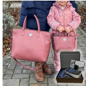
FOREVER US 6-teiliges Set | Für Mama & Tochter