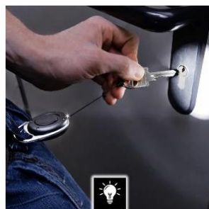
Licht und Schlüsselring (2-in-1) €5,00