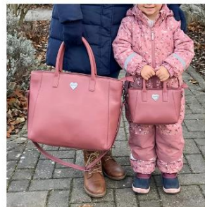
FOREVER US 2 Taschen pur