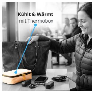
Kühlen & Wärmen: Thermobox €20,00