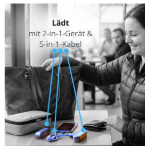
Laden: 5-in-1 Ladekabel (für alle gängigen Geräte und Anschlüsse) €5,00