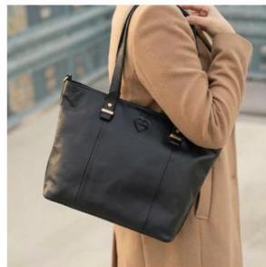
DIE EXECUTIVE Tasche pur