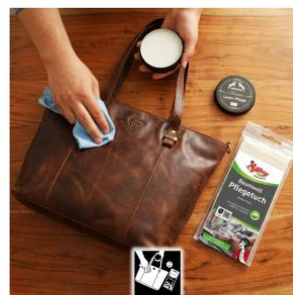
Lederpflege für BenBag-Taschen €10,00