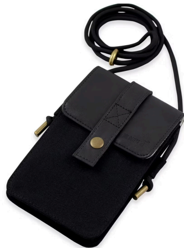
Handytasche Schwarz Nicht verfügbar